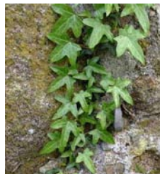
HEDERA HELIX (LIERRE)

Plante vivace à port retombant. Feuillage persistant.