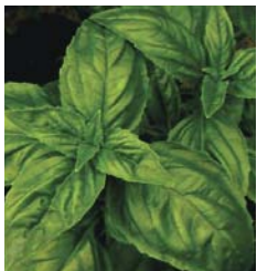
OCIMUM BASILICUM (BASILIC)

fleurs: du mauve pâle à foncé au blanc, du printemps au début de l'été