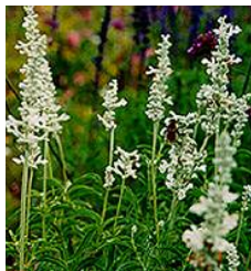
SALVIA OFFICINALIS (SAUGE)

fleurs: petites, de l'été au début de l'automne, blanches