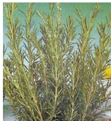
ROSMARINUS OFFICINALIS (ROMARIN)

fleurs: de la fin du printemps à l'automne, parfumées et mellifères, de couleur rose à mauve pâle