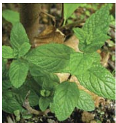
MENTHA VIRIDIS (MENTHE VERTE)

fleurs: divisées en segments très bouchés, vert foncé