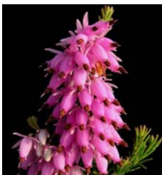
ERICA CARNEA (BRUYÈRE).

Hedera helix «Emerald Gem»: petites feuilles émeraude très pointues.