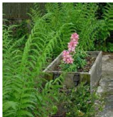
FOUGÈRE (DRYOPTERIS FILIX - MAS- POLYPODIUM VULGARE)

Vivace à feuillage persistant, compact à floraison abondante tout l'été (blanc, jaune, orange, rouge). Feuillage vert ou bronze.