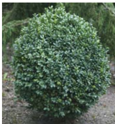
BUXUS SEMPERVIRENS (BUI)