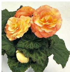
BEGONIA TUBEROSA (BÉGONIA TUBÉREUX)

Vivace à feuillage persistant, compact à floraison abondante tout l'été (blanc, jaune, orange, rouge). Feuillage vert ou bronze.