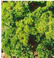
PETROSELINUM CRISPUM (PERSIL)